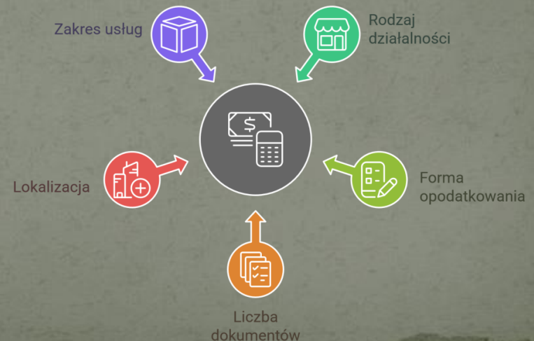
Czynniki wpływające na koszty księgowości

To firmy zatrudniające poniżej 50 osób i osiągające dochód roczny nie przekraczający 10 mln euro. Księgowość to system rejestrowania, klasyfikowania i analizowania wszystkich finansowych zdarzeń gospodarczych danej jednostki. Rolą księgowości jest zapewnienie zgodności z przepisami, kontrola kosztów i zarządzanie finansami.